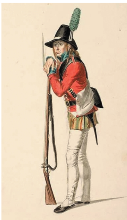
Soldat fra Landeværnet. Originalakvarel af Johs. Senn, 1807. Statens Museum for Kunst

5 Køge Rådhus , Torvet, Køge. Under kampen i byen besatte og forsvarede landeværnssoldaterne råd-